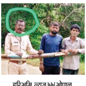
हरिभूमि न्यूज ►► मोपाल