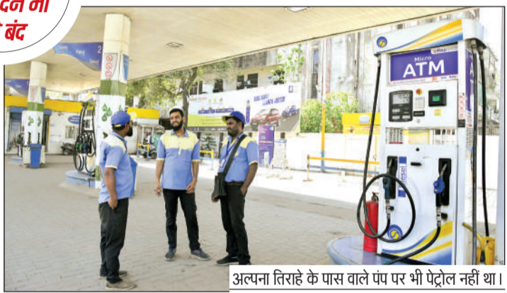
अल्पना तिराहे के पास वाले पंप पर भी पेट्रोल नहीं था।

होशंगाबाद रोड के दो पंप दूसरे दिन भी रहे बंद