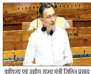
वाणिज्य एवं उद्योग राज्य मंत्री जितिन प्रसाद

79 केंद्रीय कानूनों के कुल 784 प्रावधानों में बदलाव प्रस्तावित