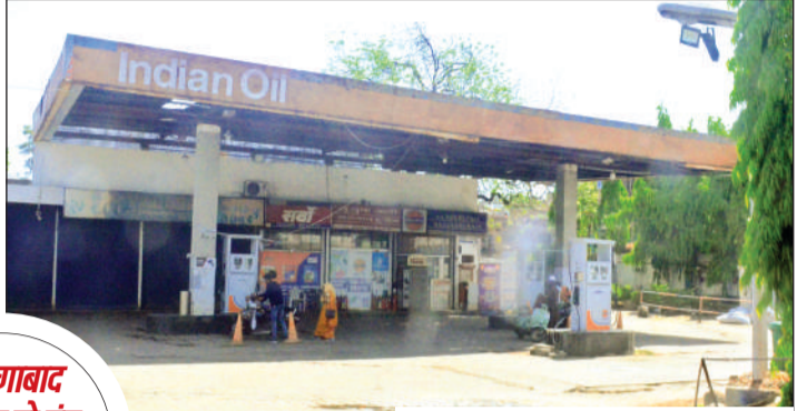
मॉडल ग्राउंड स्थित इंडियन ऑइल का सूखा पंप।