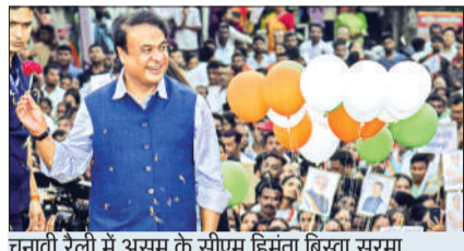
युवावी रेली में असम के सीएम हिमंता बिस्वा सरमा

असम के सीएम हिमंता बिस्वा सरमा ने बिहपुरिया में एक रेली में अपने अगले कैबिनेट में युवाओं के लिए 2 लाख सरकारी नौकरियों का वादा किया, जबकि 10 लाख युवाओं को उद्यम के लिए 2 लाख रुपये प्रति व्यक्ति की सहायता प्रदान की जाएगी। सरमा ने कहा कि अगली सरकार बनने पर वह शिक्षा को मुफ्त कर देगी। रंगनाडी में सीएम शर्मा ने विपक्षी कांग्रेस पर निशाना साधते हुए दावा किया कि पार्टी राज्य में कभी सत्ता में वापस नहीं आएगी। लखीमपुर जिले के दाकुआखाना में उन्होंने कहा कि सत्ता में वापस आने पर उनकी सरकार राज्य में बांग्लादेशी 'मियां' समुदाय की कमर तोड़ देगी। सरकार एक मजबूत अस्मिया समाज के निर्माण के लिए काम करेगी और अवैध प्रवासी मूल निवासियों को चुनौती नहीं दे सकेगी। हमने राज्य के मूल निवासियों के लिए बहुत मेहनत की है। जो लोग बांग्लादेश से आकर असम की जमीन और धरों पर अतिक्रमण कर रहे थे, हमने राजनीतिक रूप से उनके हाथ-पैर तोड़ दिए।