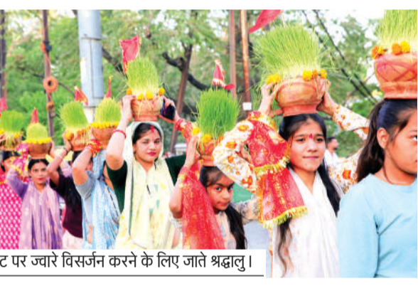
कालीघाट पर ज्वारे विसर्जन करने के लिए जाते श्रद्धालु।

भोपाल। हे माता महागौरी हमारी संतान को दीर्घायु और सुखद जीवन देना। हे मां भगवती हमारे बच्चों के भविष्य में सदैव सफलता का प्रकाश देना। चैत्र नवरात्र की नवमी पर मां दुर्गा की पूजा और महाआरती के साथ नवरात्र का समापन हुआ। शहर के मंदिरों और पंडालों में दोपहर के बाद कन्या भोज का आयोजन किया गया। इस दौरान ईको फ्रेंडली पत्तल, दोने और गिलास का उपयोग किया गया। सुबह से ही देवी मंदिरों में श्रद्धालुओं की भीड़ उमड़ी। सोमवारा भवानी मंदिर और काली मंदिर पुल पुख्ता में मेले जैसा माहौल रहा। श्रीदुर्गा मंदिरों में यज्ञ-हवन और विशेष पूजा-अर्चना के साथ श्रद्धालु देवतियों ने माता महागौरी से अपने बच्चों के लिए आशीर्वाद मांगा। पौराणिक आधार पर यह मान्यता है कि महागौरी की पूजा से संतान के कार्यों में सफलता मिलती है। राजधानी के कपयुवाली माता मंदिर, मिनाल का सर्वधर्म मंदिर, टीटी नगर माता मंदिर, बिड़ला मंदिर, साईंनाथ नगर, हमीदिया रोड दुर्गा मंदिर, करोंद दुर्गा मंदिर के अलावा सलकनपुर स्थित विजयासिन माता मंदिर, तरावली स्थित हरसिद्धि माता मंदिर, मां कंकाली माता मंदिर में भी कन्याभोज और भंडारे का आयोजन किया गया।