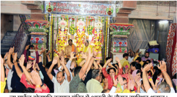
न्यू मार्केट खेड़ापति हनुमान मंदिर में आरती के दौरान उपस्थित श्रद्धालु।