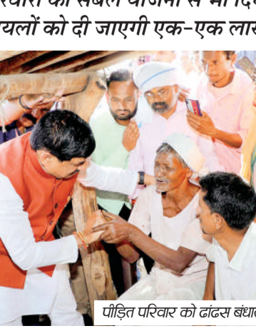
पीड़ित परिवार को दानस बंधाते सीएम

परिवारों को संबल योजना से भी दिए जाएंगे 4-4 लाख रुपए घायलों को दी जाएगी एक-एक लाख की आर्थिक सहायता