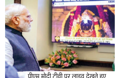
पीएम मोदी टीवी पर लाइव देखते हुए