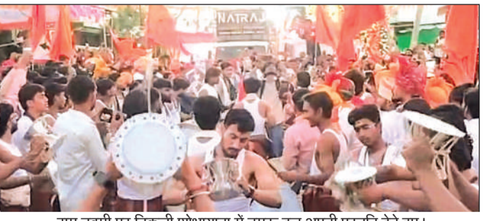
राम नवमी पर निकली शोभायात्रा में डमरु दल अपनी प्रस्तुति देते हुए।