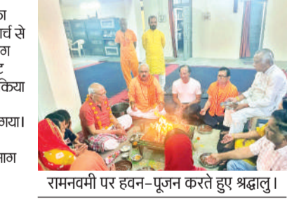
रामनवमी पर हवन-पूजन करते हुए श्रद्धालु।