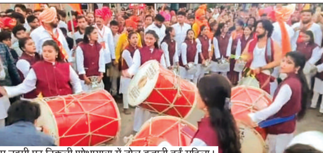
राम नवमी पर निकली शोभायात्रा में डोल बजाती हुई महिला।