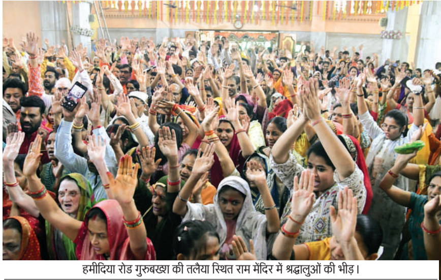
हमीदिया रोड गुरुबख्श की तलेया स्थित राम मंदिर में श्रद्धालुओं की भीड़।