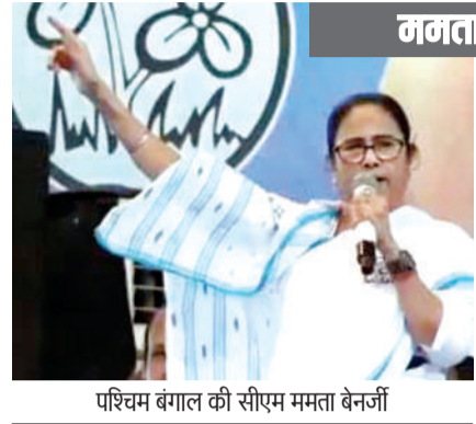
पश्चिम बंगाल की सीएम ममता बेनर्जी

वीडियो से छवि खराब करने और तनाव भड़काने का आरोप