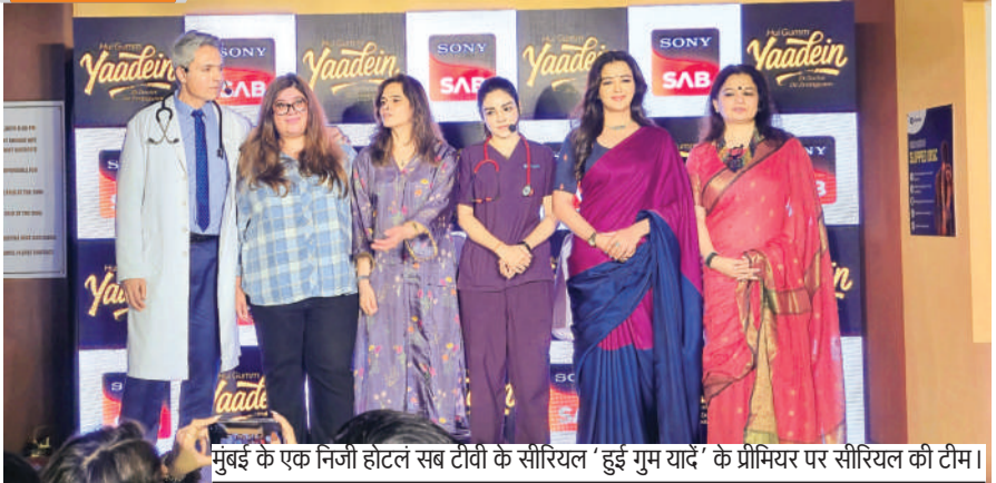
मुंबई के एक निजी होटल सब टीवी के सीरियल 'हुई गुम यादें' के प्रीमियर पर सीरियल की टीम।

इटालियन सीरियल डॉक को भारतीय इमोशन में किया कंक्ट डॉक्टर, मरीज और उसके इमोशन से जुड़ी कहानी है यादें