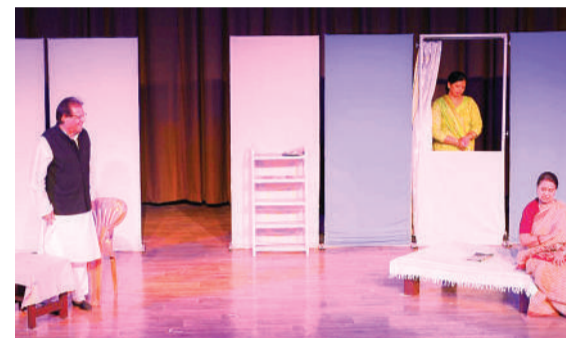
हरिभूमि न्यूज भोपाल

उर्दू ड्रामा फेस्टिवल में तीसरे दिन 'छोटी बड़ी बातें-9' के अंतर्गत तीन नाट्य प्रस्तुतियां