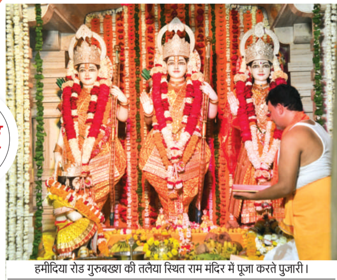
हमीदिया रोड गुरुबख्श की तलेया स्थित राम मंदिर में पूजा करते पुजारी।