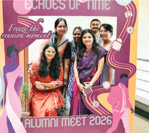
निफ्ट में तीसरे एलुमनाई मीट का आयोजन एवं अभिव्यक्ति का अनावरण

मेरे छात्र मेरा ब्रांड हैं। वे जहां भी नाम लेकर जाएंगे। वहीं कैपस जाएंगे, अपने साथ निफ्ट भोपाल का एकेडमिक को-ऑर्डिनेटर डॉ.