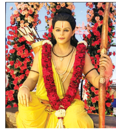
शोभायात्रा में भगवान श्रीराम की प्रतिमा।

हरिभूमि न्यूज। मंडीदीप जहां एक ओर पूरा देश रामनवमी के अवसर पर भक्ति के रंगों से शराबोर रहा, वहीं उद्योग नगरी में जिले की सबसे बड़ी शोभायात्रा का आयोजन शुरूआत दोपहर 3 बजे किया गया। नगर के वार्ड 23 गज्जू पिपलिया के राम जानकी मंदिर में सर्वप्रथम सुंदरकांड का आयोजन किया गया। उसके बाद भगवान राम की भव्य शोभायात्रा निकाली गई, जिसमें शहर के करीब 1 लाख से अधिक राम भक्त इसके साक्षी बने। शोभायात्रा में डीजे, बैड-बाजा और डमरु दल शामिल हुआ। वहीं बड़ी संख्या में राम भक्त अपने हाथों में धर्म ध्वजा लेकर चलते रहे। वहीं शोभायात्रा मुख्य रूप से नगर के गज्जू पिपलिया, शनिवार बाजार, मुख्य मार्ग, वार्ड 11 से होते हुए गांधी नगर में संपन्न हुई। शोभायात्रा में भगवान श्री राम की झांकी मुख्य रूप से आकर्षक का केंद्र रही, वहीं रामभक्त हनुमान की दिव्य झांकी ने भक्तों का मन मोह लिया। कार्यक्रम में मुख्य रूप से हिंदू सनातन के लोगों ने अलग-अलग जगह पर फूल वर्षा कर हिंदू एकता शोभा यात्रा का का स्वागत किया। यह कार्यक्रम का लगातार सातवां वर्ष था।