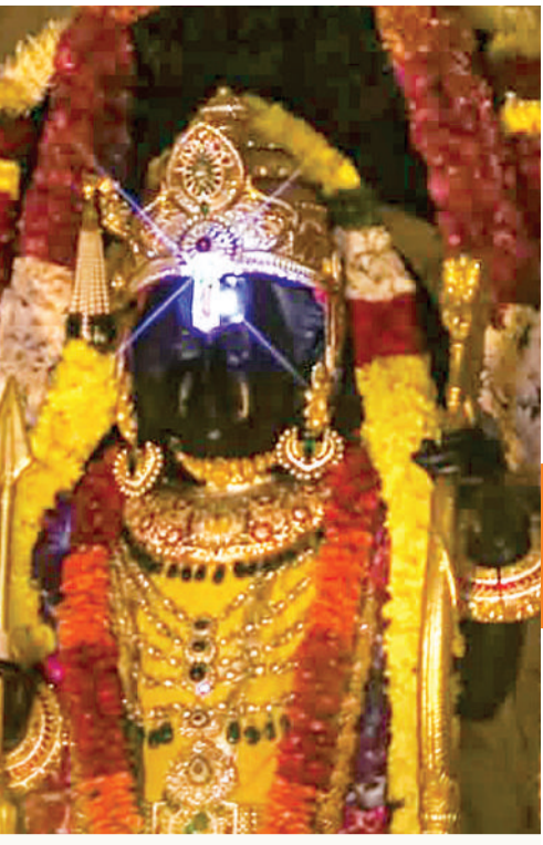
रामलला का दिव्य सूर्य तिलक

इस खगोलीय घटना को देश-दुनिया के करोड़ों श्रद्धालुओं ने सीधे प्रसारण के जरिए देखा