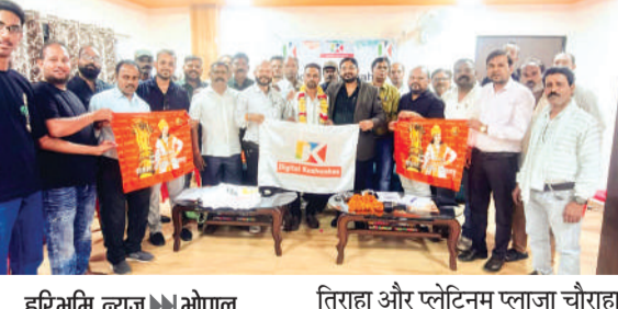
हरिभूमि न्यूज ►► मोपाल