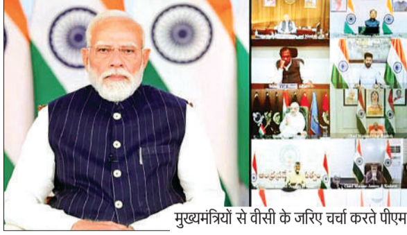
मुख्यमंत्रियों से वीसी के जरिए चर्चा करते पीएम

बंगलुरु के वैज्ञानिकों ने सूर्य की गति का गहन अध्ययन कर ये खास उपकरण तैयार किए हैं। ट्रस्ट के अनुसार इन उपकरणों की डिजाइन ऐसी है कि अगले 19 साल तक सूर्य की गति में होने वाले बदलावों के बावजूद किसी छेड़छाड़ की जरूरत नहीं होगी।