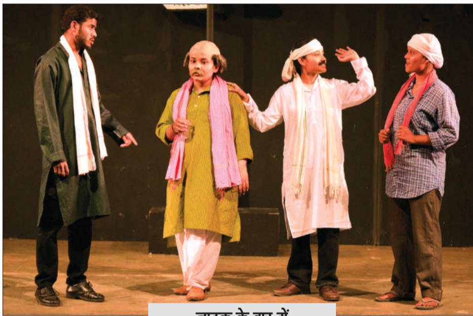
नाटक के बार में