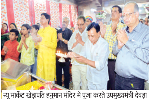
न्यू मार्केट खेड़ापति हनुमान मंदिर में पूजा करते उपमुख्यमंत्री देवड़ा।