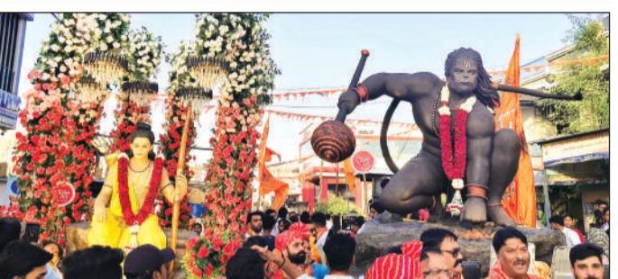
राम नवमी के पावन अवसर पर शुरूआत को निकली शोभायात्रा में भगवान श्रीराम और रामभक्त हनुमान जी की झांकी लोगों के लिए आकर्षण का केंद्र रही।

शोभा यात्रा में ये रहे मुख्य आकर्षक के केंद्र आयोजन में कई विशेष आकर्षण रहे, जो राम भक्तों को और अधिक उत्साहित किया। इसके अलावा अक्षय हट्टेट के साथ नटराज डीजे, बाबा बटेश्वर भक्त मंडल भोपाल ने भक्ति एवं समर्पण से यात्रा को आध्यात्मिक ऊर्जा प्रदान किया। इसके अलावा अक्षय हट्टेट भोपाल आयोजन की व्यवस्था एवं सजावट महत्वपूर्ण रही। यह पवित्र आयोजन श्री राम जन्म उत्सव संगठन, समस्त सनातनी शहरी एवं ग्रामीण क्षेत्र, मंडीदीप द्वारा आयोजित किया गया।