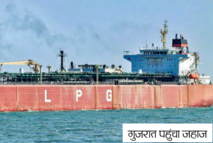
गुजरात पहुंचा जहाज

अफवाह फैलाना और बेवजह डर का माहौल बनाना गैर जिम्मेदाराना और हानिकारक